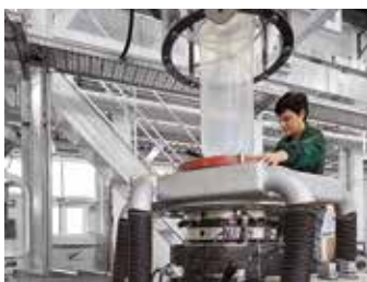
Extrusion-film du MATER-BI