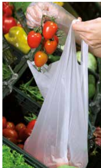
Sac fruits et légumes en MATER-BI