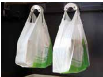
Jogging test dans les laboratoires NOVAMONT